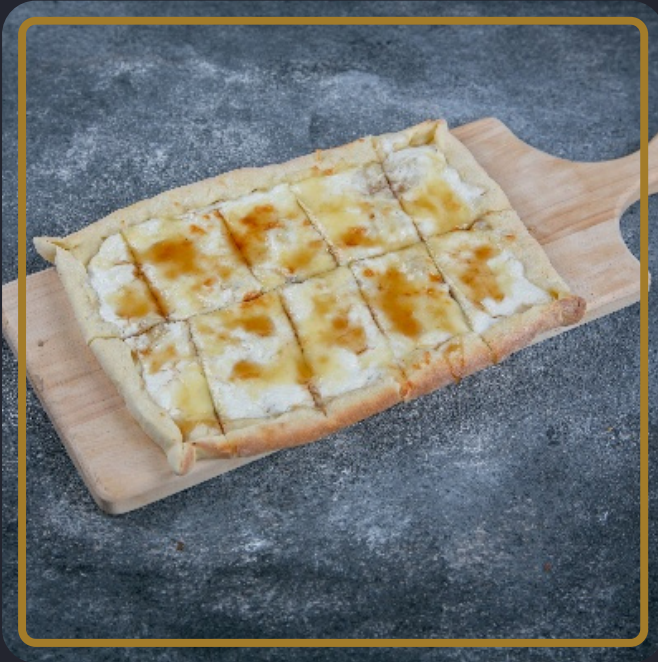
عجينة عيش البلبل