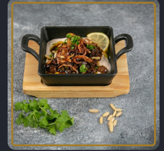
طبق الشيف الخاص