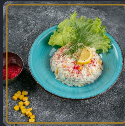
سلطة لسان العصفور