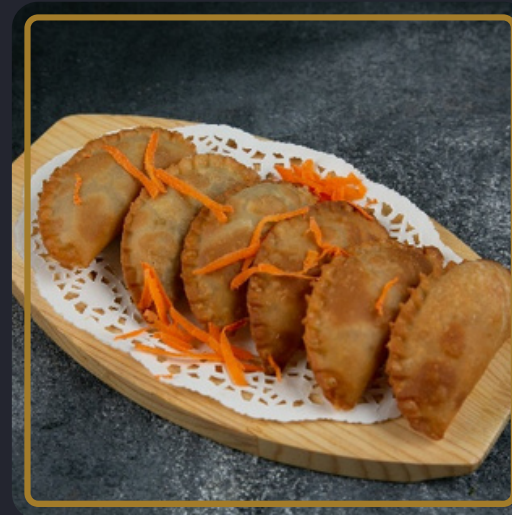
سمبوسة البف مشكل