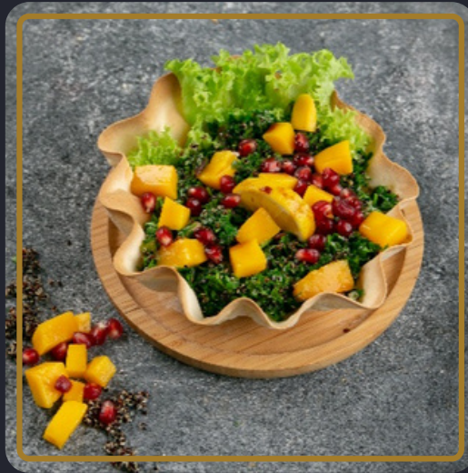
تبولة كينوه بالمانجو