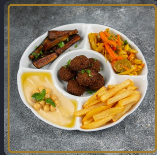
صحن فلافل مشكل