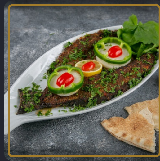
سمك مشوي سيياس