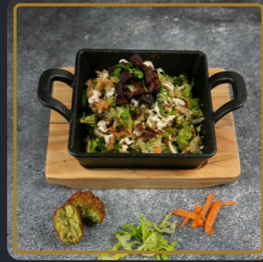
فلافل بن عاقول