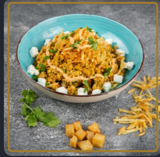
شكشوكة بن عاقول