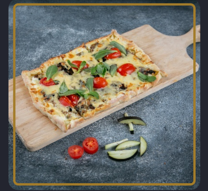
عجينة بن عاقول